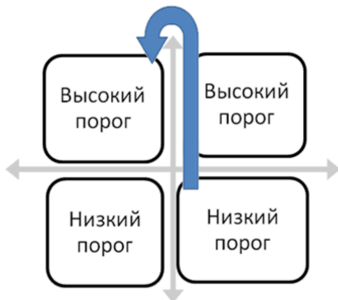
Рис. 4. Схема динамики пороговых значений эмоционального реагирования.

Кроме контекстности эмоционального реагирования (эмоциогенной ситуации), по результатам исследования мы смогли выделить направленность эмоциональных реакций (объект реакции или его отсутствие). Так, эмоцию может вызывать как сама ситуация в целом, так и конкретные объекты (предмет, человек), имеющие высокую значимость или эмоциональную нагрузку. Для детей дошкольного возраста в этом качестве могут выступать любимые или новые, не освоенные ими игрушки, а также статусные сверстники, значимые члены семьи или члены педагогического коллектива (см. табл. 5).