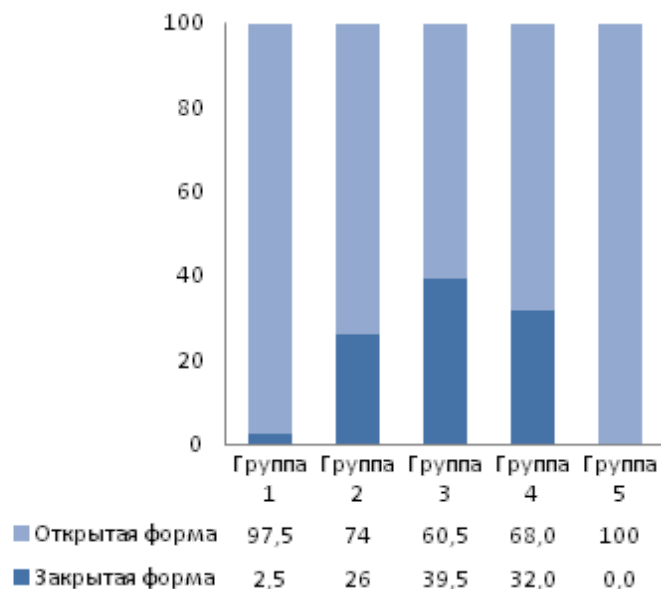
Рис. 2. Распределение (процентное соотношение) открытой и закрытой форм эмоционального реагирования детей 6–7 лет в соответствии с группами эмоциогенных ситуаций.

Примечания. Группа «сверстники» – 1, группа «педагоги» – 2, группа «члены семьи» – 3, группа «режимные моменты» – 4, группа «сюрпризные моменты» – 5.