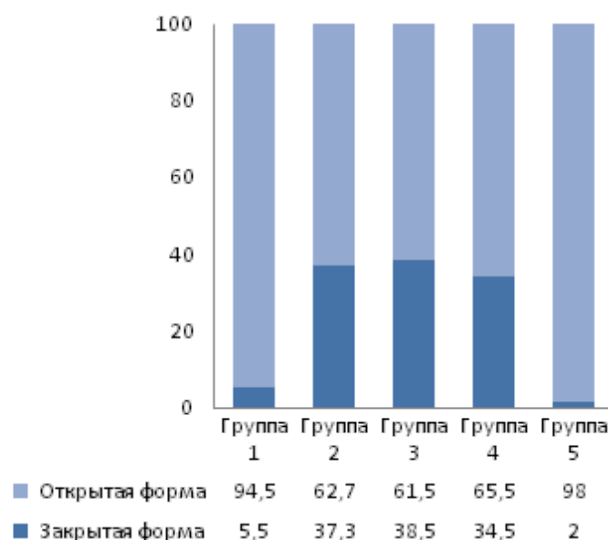
Рис. 1. Распределение (процентное соотношение) открытой и закрытой форм эмоционального реагирования детей 5–6 лет в соответствии с группами эмоциогенных ситуаций.

Большинство детей выборки, независимо от их возраста, продемонстрировали открытую форму эмоционального реагирования. В группе детей 5–6 лет высокой степенью экспрессивности отличаются 76% подвыборки, в группе детей 6–7 лет – 80%. Что касается закрытой формы реагирования, то 24% (5–6 лет) и 20% (6–7 лет) внутри возрастных подвыборок составляют дети с эмоциональной невыразительностью (см. рис. 1, 2).